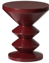
02 VINO DAB 102 VINO JESION