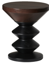
06 HEBAN - 01 BLACK DAB