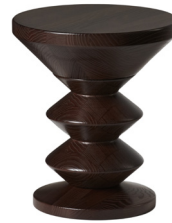
04 HEBAN DAB