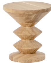
07 NATURA DAB