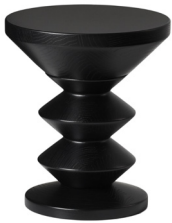
01 BLACK DAB 101 BLACK JESION