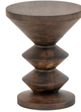
08 NUT DAB