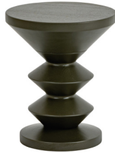
03 GREEN DAB 103 GREEN JESION