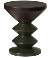
05 HEBAN - 03 GREEN OAK