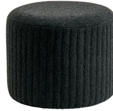
12 BLACK BOUCLE