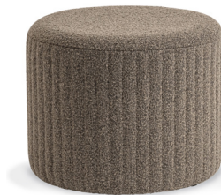
06 MOUSE BOUCLE